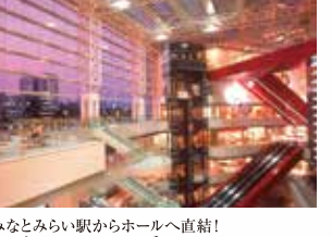
みなとみらい駅からホールへ直結!この大エスカレーターに乗って横浜みなとみらいホールへ