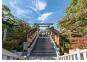
音楽堂より徒歩5分、横浜総領事伊勢山皇大神宮