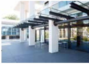
神奈川県立図書館本館3階のオープンテラス