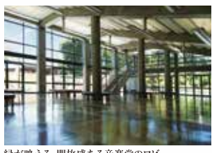
緑が映える、開放感ある音楽堂のロビー