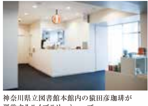
神奈川県立図書館本館内の猫田彦珈琲が運営するライブラウンジショップ