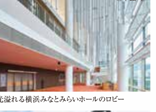
光溢れる横浜みなとみらいホールのロビー