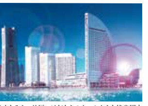
みなとみらい地区へはどちらのホールからも徒歩圏内

相次ぐ物価高で厳しい懐状況けど、やっぱり音楽のない生活なんて考えられない!そんな方を、アフタヌーンコンサートは応援します。各5公演セット券は3公演分+aの料金で5公演分お楽しみいただける、驚異の価格設定を実現!割安なチケットにより「浮いた」お金で、コンサート帰りに美味しいものを食べたり別のコンサート・チケットを買ったり。この価格設定だからこそ、人生にプライスレスな潤いを提供できるのです。