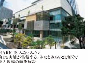
MARK IS みなとみらい約170店舗が集結する、みなとみらい21地区で最大規模の商業施設