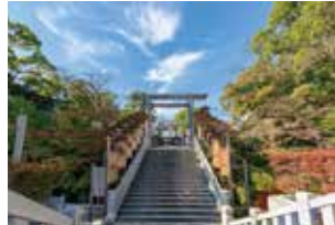
音楽堂より徒歩5分、横浜総領事伊勢山皇大神宮