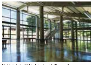
緑が映える、開放感ある音楽堂のロビー

相次ぐ物価高で厳しい懐状況だけど、やっぱり音楽のない生活なんて考えられない!そんな方を、アフタヌーンコンサートは応援します。各5公演セット券は3公演分+aの料金で5公演分お楽しみいただける、驚異の価格設定を実現!割安なチケットにより「浮いた」お金で、コンサート帰りに美味しいものを食べたり別のコンサート・チケットを買ったり。この価格設定だからこそ、人生にプライスレスな潤いを提供できるのです。