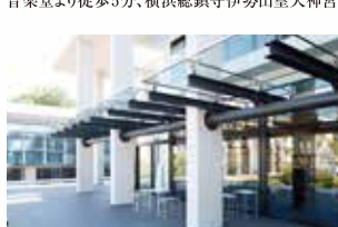
神奈川県立図書館本館3階のオープンテラス