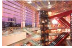
みなとみらい駅からホールへ直結! この大エスカレーターに乗って 横浜みなとみらいホールへ