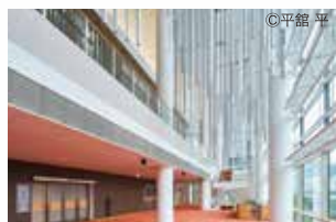
光溢れる横浜みなとみらいホールのロビー