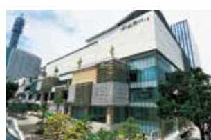
MARK IS みなとみらい 約175店舗が集積する、みなとみらい21地区で 最大規模の商業施設