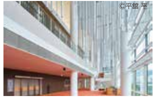
光溢れる横浜みなとみらいホールのロビー