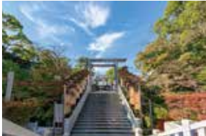
音楽堂より徒歩5分、横浜総領事伊勢山皇大神宮