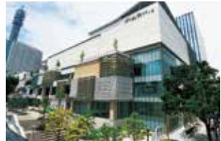
MARK IS みなとみらい 約175店舗が集積する、みなとみらい21地区で 最大規模の商業施設