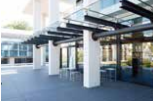
神奈川県立図書館本館3階のオープンテラス