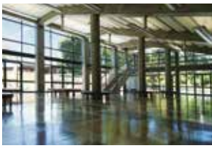
緑が映える、開放感ある音楽堂のホワイエ

相次ぐ物価高で厳しい現状だけれど、やっぱり音楽のない生活なんて考えられない!そんな方を、アフタヌーンコンサートは応援します。各5公演セット券は3公演分+aの料金で5公演分お楽しみいただける、驚異の価格設定を実現!割安なチケットにより「浮いた」お金で、コンサート帰りに美味しいものを食べたり別のコンサート・チケットを買ったり。この価格設定だからこそ、人生にプライスレスな潤いを提供できるのです。