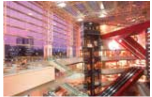
みなとみらい駅からホールへ直結! この大エスカレーターに乗って 横浜みなとみらいホールへ