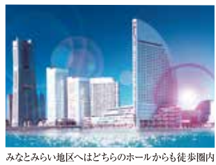
みなとみらい地区へはどちらのホールからも徒歩圏内