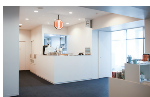
神奈川県立図書館本館内の猿田彦珈琲が 運営するライブリーショップ