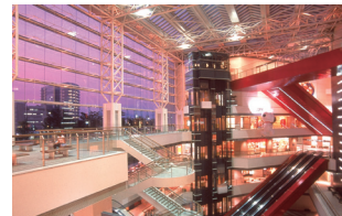
みなとみらい駅からホールへ直結! この大エスカレーターに乗って 横浜みなとみらいホールへ