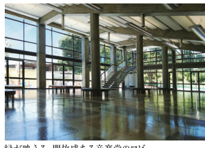
緑が映える、開放感ある音楽堂のロビー

相次ぐ物価高で厳しい現状だけでなく、やっぱり音楽のない生活なんて考えられない!そんな方を、アフタヌーンコンサートは応援します。各5公演セット券は3公演分+Aの料金で5公演分お楽しみいただける、驚異の価格設定を実現!割安なチケットにより「浮いた」お金で、コンサート帰りに美味しいものを食べたり別のコンサート・チケットを買ったり。この価格設定だからこそ、人生にプライスレスな潤いを提供できるのです。