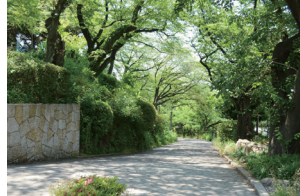
コンサート前後の散策にぴったり! 音楽堂裏手の静謐な時間が流れる掃部山公園