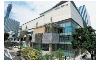
MARK IS みなとみらい 約175店舗が集積する、みなとみらい2地区で 最大規模の商業施設